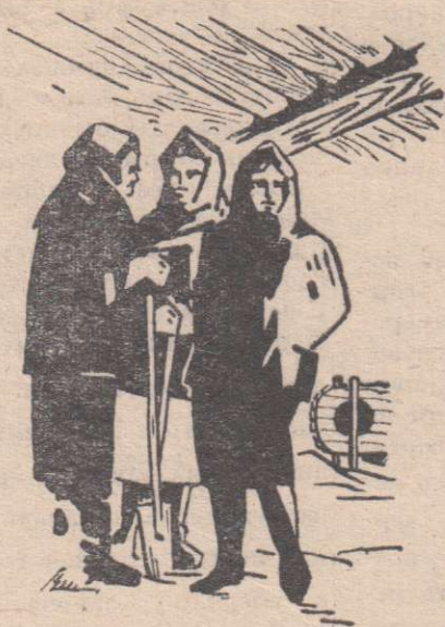
Рисунок В. Щербакова.

И вот приехала ночная смена. Веселые девчата — колхозницы разбрасывают серебряные трели: