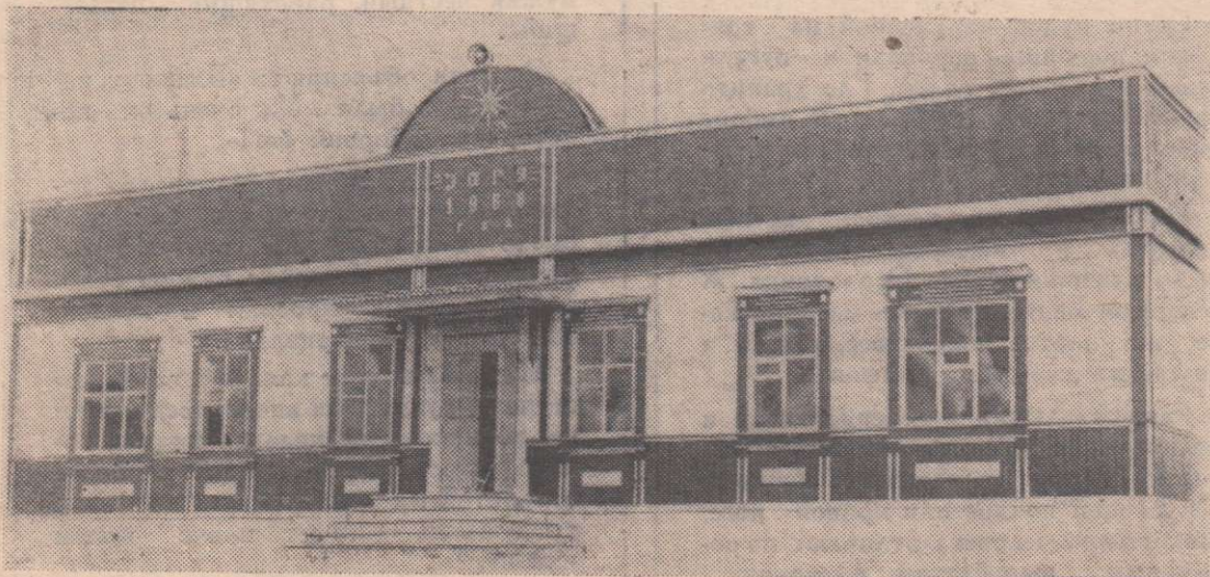
НОВЫЙ КЛУБ В д. БОРКИ.

Типография газеты «Дзержинец» Тираж 3250. Заказ № 663.